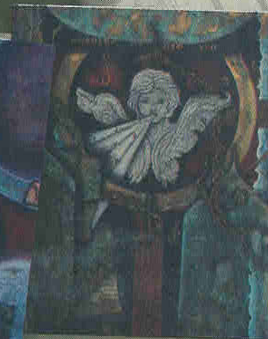
Respiro de dio